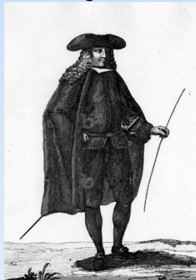
Illustration : un officier de la justice royale — généralité d'Orléans, XVIII e . Gravure par Jean de La Cruz.

NE PAS JETER SUR LA VOIE PUBLIQUE Contact : lepetitjanvillois@gmail.com